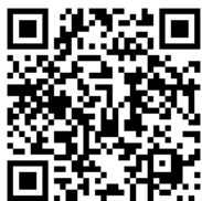
Inscripción telefonía móvil.